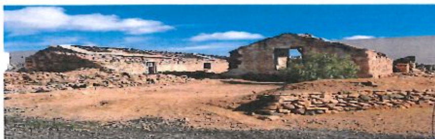
Casa frente al Ayuntamiento

PLAZA DE LA CONSTITUCIÓN, 10. 1º. 2017 20 ABR 2017