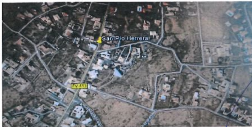
Como se puede ver solo aparece la C/ San Pio Herrera

Antecedentes: Hace ya algunos años a las calles de Triquivijate se le pusieron nombres por acuerdo del Pleno. Cierto es que transcurrido algún tiempo aún hay algunas de ellas a las que no se les ha puesto la placa identificativa u otras a las que se le ha caído y no se ha repuesto. Pero lo más grave, sin dejar de ser lo manifestado, es que todavía muchos Organismos Oficiales se dirigen a nuestros vecinos sin atender ni a calles, ni domicilios correctos, etc. Ello viene a causar infinidad de molestias en cuanto se pierde correspondencia o notificaciones oficiales, en muchas ocasiones, de vital importancia para nuestros vecinos. Todas estas molestias se podrían solucionar aprobando y haciendo un seguimiento a su cumplimiento por este Ayuntamiento la siguiente propuesta.