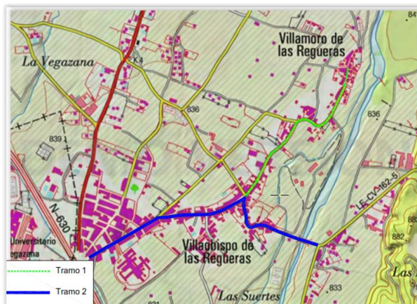
Imagen 2.3.1 Croquis de situación de los tramos a ceder.

Cesión al Ayuntamiento de Villaquilambre de los tramos de carreteras indicados en el asunto de referencia que se citan a continuación y que se señalan en la imagen 2.3.1.