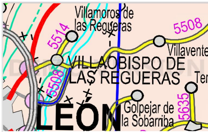
Imagen 2.4.3. Croquis vía alternativa a los tramos 1 y 2 a ceder. (LE-5508).

De acuerdo con esto se dan las circunstancias para ceder los tramos 1 y 2 de la solicitud, es decir la de tener la condición de tramo urbano y existir otra alternativa viaria que proporcione un mejor nivel de servicio, que permite entregar la totalidad del tramo de carretera que queda sustituido por la variante.